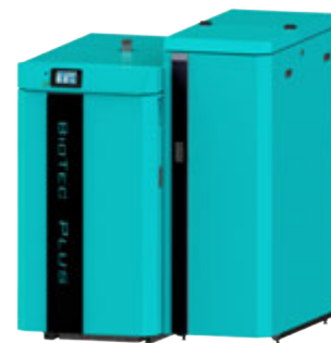
GOTFire BioTec Plus | 35