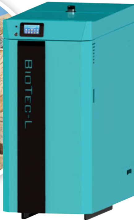
GOTFire BioTec L | 25-45