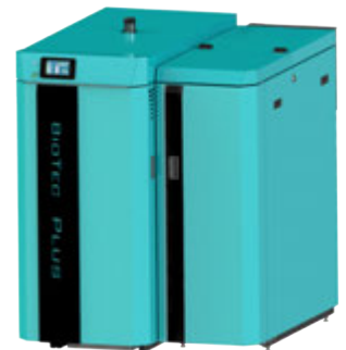
GOTFire BioTec Plus | 25