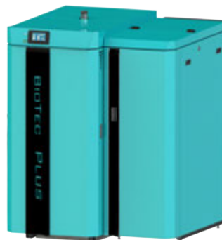
GOTFire BioTec Plus | 45